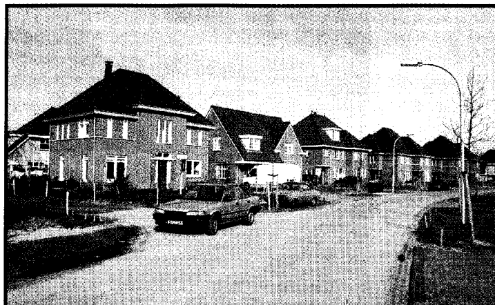
Boswijk in Ypenburg, een van de vele nieuwe buurten met 'jaren-dertig-woningen'