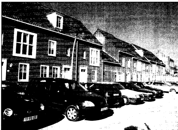
Neotraditionalisme volgens de formule 'donkere baksteen, zwarte pannen en gebroken gevellijn' in Vathorst, Amersfoort, 2005 Harry Entveld

'Architecten zijn net mensen: ze doen elkaar na'