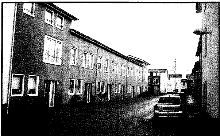
Neotraditionalistische straat in een Vinex-wijk: is dit Vathorst of Florandé?